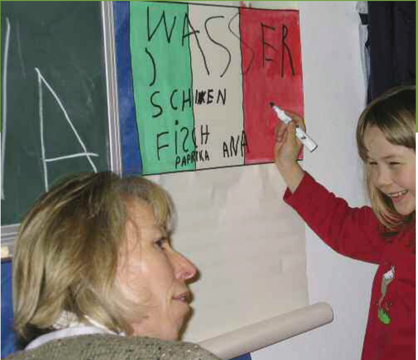
„Ich kann schon schreiben!“

>>> sem Grund auch das Überspringen von Klassen ab. Diese Kinder zu motivieren, ist im Schulalltag kaum möglich. Nach unserer Erfahrung sind solche Kinder bei adäquater außerschulischer Förderung jedoch hoch motiviert und leistungsstark.