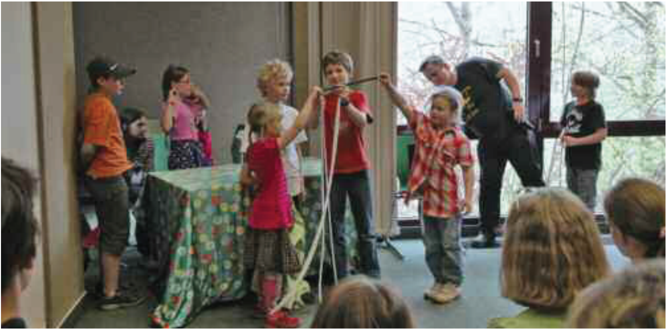
Präsentieren lernen wir gleich mit