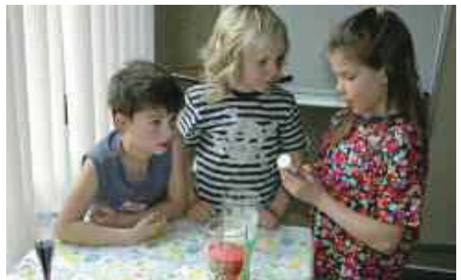
Wie viel muss da rein?