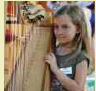
... und Musizieren