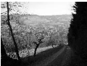
Riedenberger Impressionen

Der frühe Ostertermin und die Erfahrungen vom letzten Jahr haben das Schlimmste befürchten lassen – Winterreifen drauflassen, noch einen Pullover mehr mitnehmen, viele Spiele mitnehmen, vielleicht doch besser die Gummistiefel einpacken, Mütze, Handschuhe, Schal – vielleicht sollte man eine Schlitten mitnehmen. Doch der Wettergott war uns gnädig – Sonne vom ersten bis zum letzten Tag. Zwar waren die Nachttemperaturen noch eisig, doch die Nachmittage erinnerten doch schon stark an Schwimmbad und Picknick.